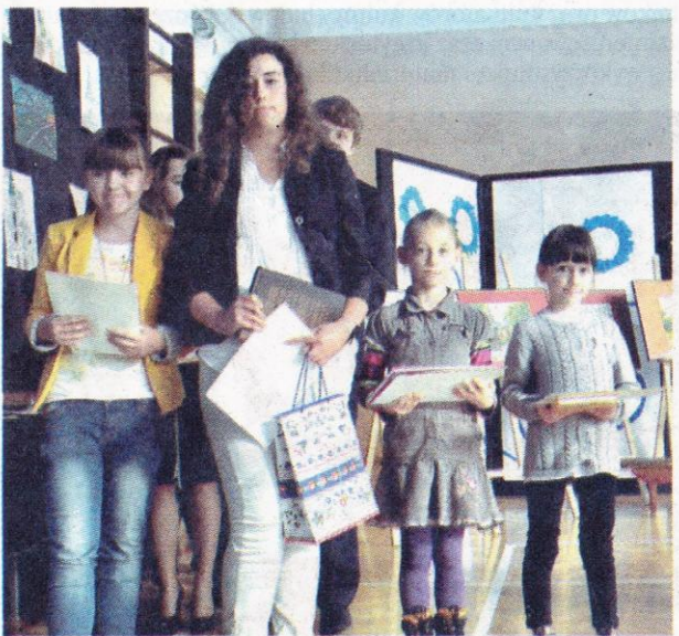
Dumne laureatki konkursu plastycznego.

pomarańczy z importu i szynki jezdzonej zaledwie kilka razy do roku.